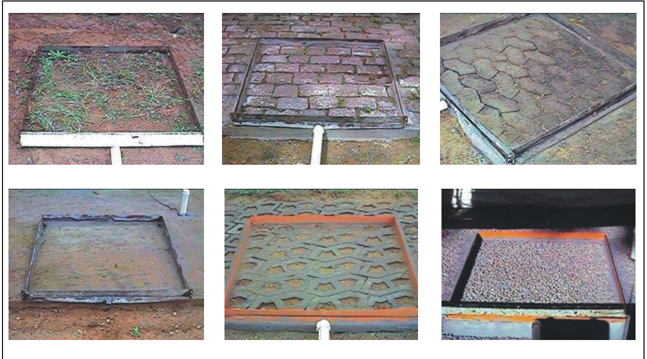
Figura 2. Pavimentos simulados.

As pedras interiores na parcela de 1\text{ m}^2 de paralelepípedo têm um tamanho médio de 13 \times 18\text{ cm} , em 7 linhas paralelas à face coletora. As juntas têm uma largura média de 1\text{ cm} e perfazem 6 linhas contínuas, paralelas à face coletora, com 6 juntas por cada linha de pedra. As pedras interiores da parcela de 1\text{ m}^2 de blocos de concreto industrializados formam nove linhas no sentido paralelo à face coletora, possibilitando 8 linhas de junta, com cinco juntas por linha de pedra e juntas com espessura média de 4\text{ mm} .